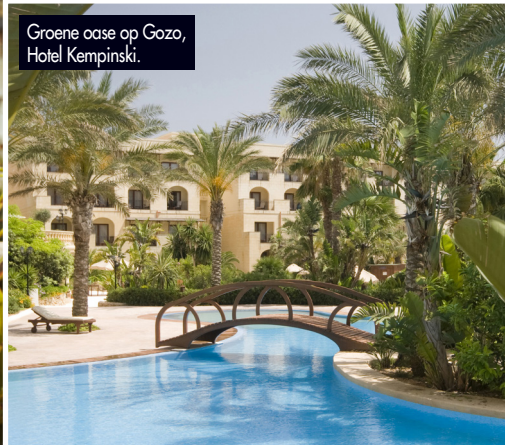
Groene oase op Gozo, Hotel Kempinski.