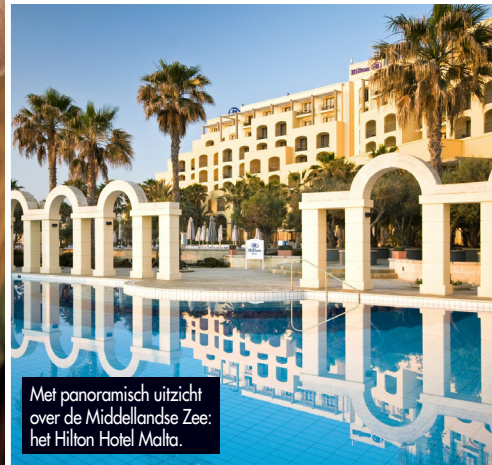
Met panoramisch uitzicht over de Middellandse Zee: het Hilton Hotel Malta.