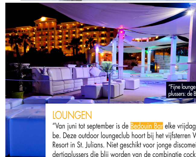
"Fijne lounge plek voor dertigplussers: de Bedouin Bar."